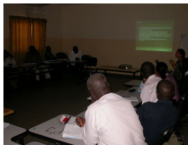
Les échanges sur le outcome mapping