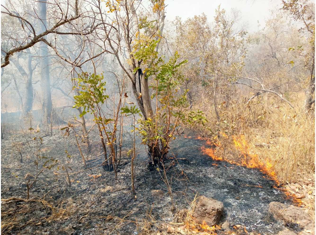
Photo 1 : Feu à MYF dans la forêt classée de de Pata. Crédit photo : CSE, 27/ 02/2022