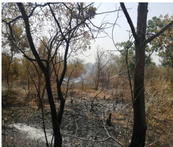
Figure 1: Cas de feu à Mayor dans le département de bounkiling

Les 1er et 03 mars 2022, 44 cas de feu ont été détecté soit 44% des feux de la semaine en deux jours.