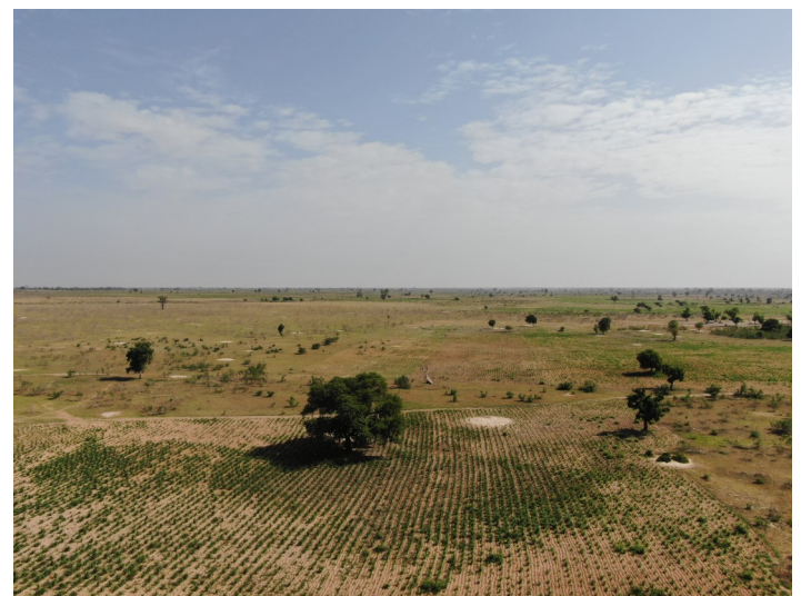
Photo 4 : Vue aérienne du tapis herbacé et d'une parcelle de culture à Kaffrine, CSE 2022